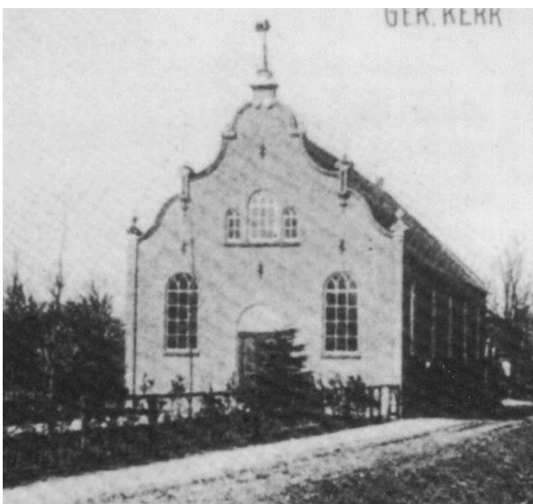
Gereformeerde Kerk na 1906 met een vernieuwde voorgevel