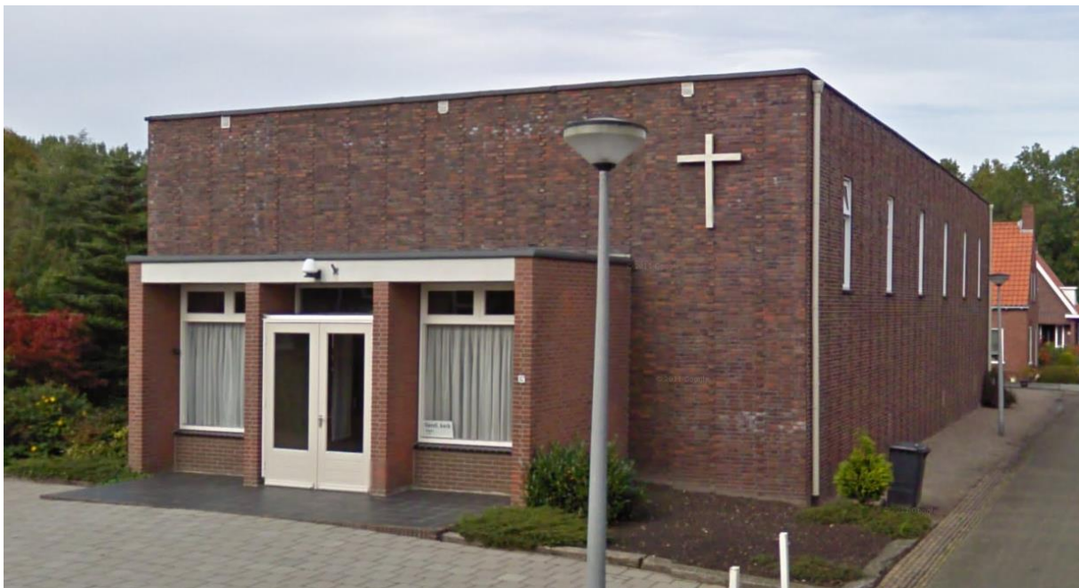
De Verbinding nu

De Verbinding is een gebouw met een multifunctionele kerkzaal en enkele kleinere zalen. De kerk heeft maximaal 250 zitplaatsen. Het gebouw is relatief goed rolstoel- en rollatorvriendelijk.