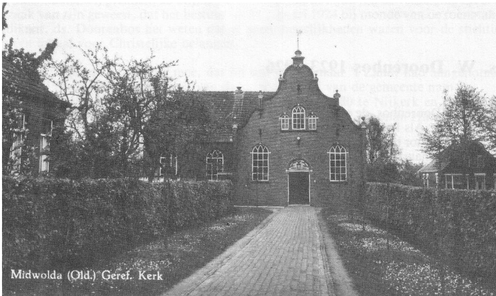
Gereformeerde Kerk na 1925

Dan volgt in 1925 een drastische verbouwing: de kerk krijgt een zijvleugel aan de westzijde.